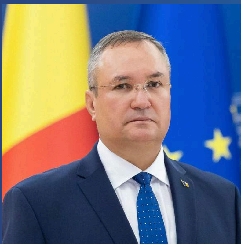
NICOLAE-IONEL CIUCĂ – MOȚIUNEA UNIȚI PENTRU O ROMÂNIE STABILĂ ȘI PUTERNICĂ – CONGRESUL PARTIDULUI NAȚIONAL LIBERAL 2022